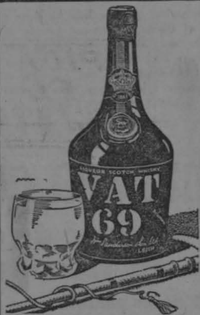
En una partida de bridge o una amena tertulia no debe faltar